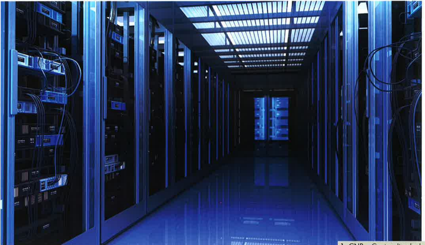
1. CNR – Centro di calcolo