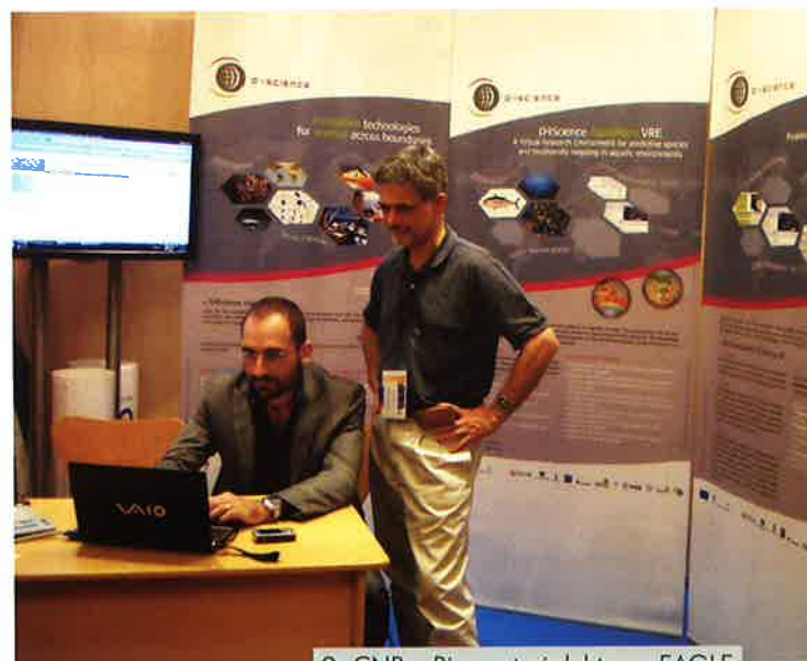
2. CNR – Ricercatori del team EAGLE

Il modello EACM è costituito da un'entità root (la radice) da cui è possibile creare istanze di quattro sotto-entità: (i) Artefact che contiene informazioni circa la natura fisica di un oggetto nel dominio epigrafico; (ii) Inscription che descrive la natura testuale e semantica di un testo eventualmente presente su un Artefact ; (iii) Visual representation che raccoglie tutte le informazioni relative alla