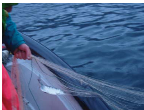
Fig. 5.2.1. Posa e salpaggio di una rete nel punto di campionamento di centro lago (Ghiffa).

I pesci sono stati misurati (lunghezza totale L_T ) e ne è stato determinato il sesso mediante eviscerazione. Per ogni esemplare è stato prelevato un campione di scaglie per la determinazione dell'età; le scaglie sono state posizionate tra due vetrini portaoggetto e successivamente analizzate utilizzando un visore a basso ingrandimento (Fig. 5.2.2). Poiché nel Lago Maggiore sono presenti due forme di coregone (lavarello e bondella C. macrophthalmus ), non distinguibili con certezza su base fenotipica, è stato necessario asportare da ogni coregone catturato anche il primo arco branchiale per il conteggio delle branchiospine, carattere meristico che permette, unito ai dati di accrescimento ed età, di discriminare, le due forme. A parità di età, il coregone lavarello ha infatti una lunghezza maggiore rispetto alla bondella e un numero medio di branchiospine minore.